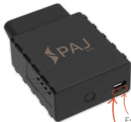
Estado do sinal LED LED FINDER Estado